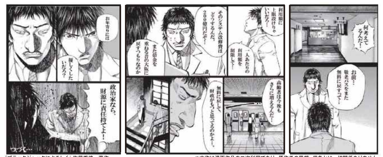
「ブラックジャックによろしく」佐藤秀峰 著作 漫画onWebより ※本作は漫画作品の二次利用であり、原作者の思想・信条とは一切関係ありません。

一定のご負担をお願いすることによって、今後も敬老パスのサービスを現実的に維持していくそれが、大阪維新の会の答えです。